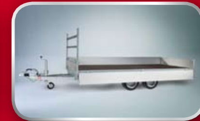
PL20C / slede