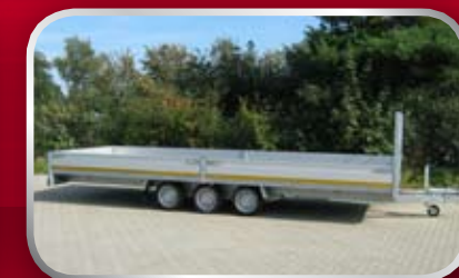
PL35G / slede