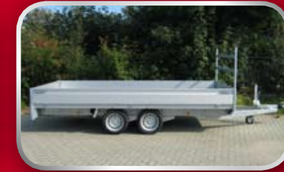
PL27C / slede