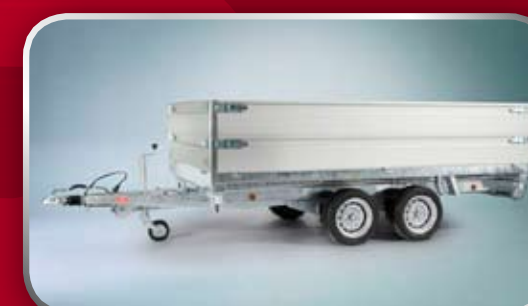
Dubbele aluminium borden