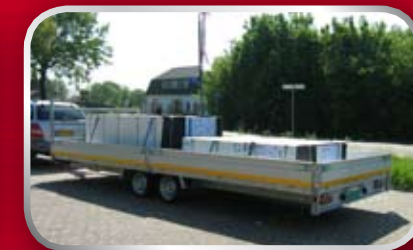
PL35G / slede