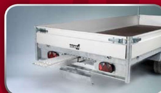
Slede ten behoeve van rijplaten