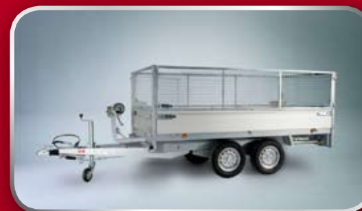
Loofrekken en handlier