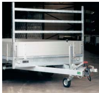
Voorrek gemonteerd (optie)