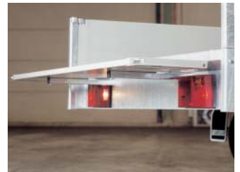
Uittrekkokers aan achterzijde

stevige constructie van de aanhangwagen, maar is het vooral ook van belang om goed zichtbaar te zijn voor andere weggebruikers. Om dat te bereiken, is de verlichting, die volgens EG-richtlijnen wordt gemonteerd, uitgebreid met zogenoemde zijmarkeringslichten. Deze zijmarkeringslichten zijn ook zichtbaar als de zijborden neergeklapt zijn. Moet u bijvoorbeeld in het donker laden, dan wordt u toch gezien. Dat is wel zo'n veilig idee.