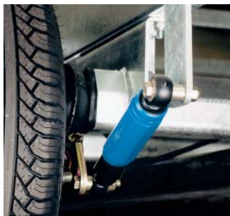
Asschokbreker gemonteerd (optie)

Ansems Aanhangwagens B.V. heeft drie verschillende modellen plateauwagens ontwikkeld, te weten PSX 1300, PSX 2000 en PSX 3000. Ze zijn alle drie geremd en in verschillende afmetingen uitgevoerd.